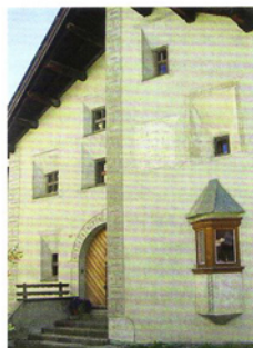
Typisches Engadiner Steinhaus

behandelt die Innenwände, als wären sie Fassaden. Sie interpretiert das räumliche Konzept der Engadiner Häuser: Der „Suler“, die typische Eingangshalle, ist offen für alle Arten von Treffen, die weiteren Räume hingegen sind introvertiert und privat. Wie in der traditionellen „Stube“ ist auch hier die Holzvertäfelung überall vorhanden, aber ohne in Klischees zu kippen. Die Fensterrahmen sind normal, wirken aber durch die Dekontextualisierung, durch ihre umgekehrte Position anders. Alles ist auf das Notwendigste reduziert: Wände, Decken und Böden sind aus Lärche. Wo es möglich war, hat die Architektin die alten Fußbodenbohlen erhalten, den Niveauunterschied zum neuen Lärchenboden aber zugelassen, damit der Unterschied von Alt und Neu im täglichen Gebrauch nicht nur sichtbar, sondern auch spürbar bleibt. Besonders und wunderbar ist die handwerkliche Qualität. Sie ist der engen Zusammenarbeit zwischen der Architektin und der lokalen Holzwerkstatt zu verdanken.