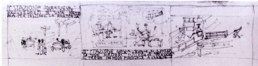
Vignetta dall'album 1923, primo episodio: la partenza

nel 1921 e si laurea nel 1926. Per meglio comprendere il significato di questo viaggio sono opportuni alcuni cenni sulla Scuola di architettura in quegli anni. Gli studi erano organizzati in un corso preparatorio di due anni e in una scuola di applicazione di tre; nel primo anno l'esercitazione progettuale si svolgeva secondo i canoni dello stile greco-romano, nel secondo di quello rinascimentale, neoclassico e barocco, nel terzo e ultimo di quello medievale. La frequenza al Politecnico comportava anche l'iscrizione all'Accademia di Brera per lo studio delle discipline figurative. La lezione dei monumenti del passato, che nella scuola tendeva piuttosto alla formazione di un gusto eclettico, viene senz'altro assimilata da Terragni come incentivo per la conoscenza dei valori del passato, nella direzione della nuova architettura.