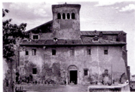
Chiesa dei Santi Quattro Coronati, Roma