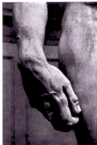
Particolare del David di Michelangelo (da Michelangelo Mappe, München s.d., AGT)