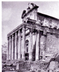
Veduta del Palatino, Roma, 26 novembre 1925