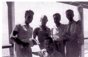
Giuseppe Terragni (a sinistra), Le Corbusier e Bardi sul ponte del Patris II, 1933