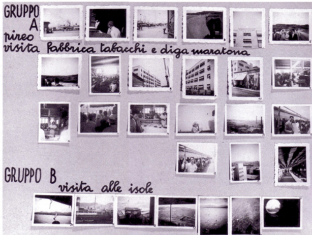
Una pagina dell'album di fotografie scattate da Giuseppe Terragni durante il viaggio in Grecia (AGT)

Terragni nella sua relazione traccia le linee fondamentali del piano regolatore di Como che presenterà al concorso dell'anno successivo insieme a Bottoni e agli altri componenti del gruppo CM8 8 . La traccia della relazione originale in francese comprende, oltre a un'introduzione sulla storia di Como, i seguenti paragrafi: Le indicazioni geologiche, I venti, Le tendenze di sviluppo, Le caratteristiche della città, Note sull'assetto fondiario, La popolazione, Le abitazioni, Il tempo libero, La circolazione. Il paragrafo finale del suo