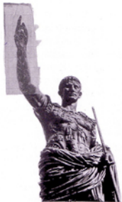
Fotografia della statua di Augusto imperatore, con applicazione di carta millimetrata (AGT)

Attraverso il disegno Terragni indaga le concatenazioni, studia le regole, le proporzioni, i materiali. In alcuni disegni scolastici, che riproducono gli altorilievi della facciata della chiesa romanica di San Fedele a Como, già si evidenzia questo metodo di analisi dei singoli elementi architettonici, rilevati caparbiamente per punti, con molta precisione. Nel viaggio invece, con un tratto più libero, verifica il terreno, indaga le forme e il rapporto con il paesaggio. Pochi tratti, spesso solo accennati, definiscono lo spazio circostante, così come accadrà in seguito nei disegni preparatori dei progetti.