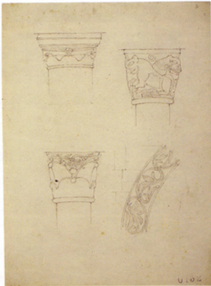
Rilievo dei capitelli e di un fregio di San Fedele, Como (AGT)

to della contemporaneità. Pensa che le nuove città di Berlino sono state costruite dal 1927 in poi.